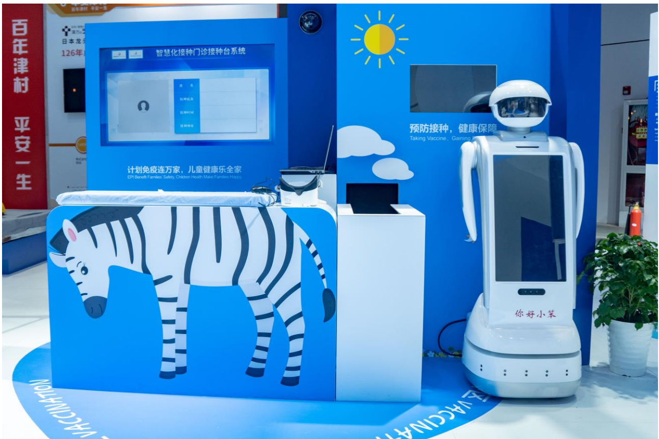
(赛诺菲展台创新体验区)

“全场景守护”疫苗接种解决方案 ，创造性地运用大数据、互联网+、人工智能等理念和新技术，观众可以体验从疫苗预约、接种到科普教育的全场景守护。