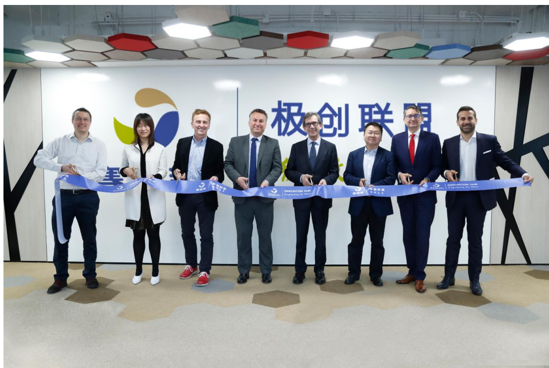
法国驻华大使黎想（左5）与赛诺菲中国区总裁彭振科（左4）等一起为“极创联盟”剪彩

2018年4月24日，中国上海 ——全球领先的医药健康企业赛诺菲宣布，其新兴市场首个数字化创新平台——“极创联盟”今天正式落户中国。这是跨国药企积极响应中国“互联网+医疗健康”举措，推进本土数字化战略中的重要一步。