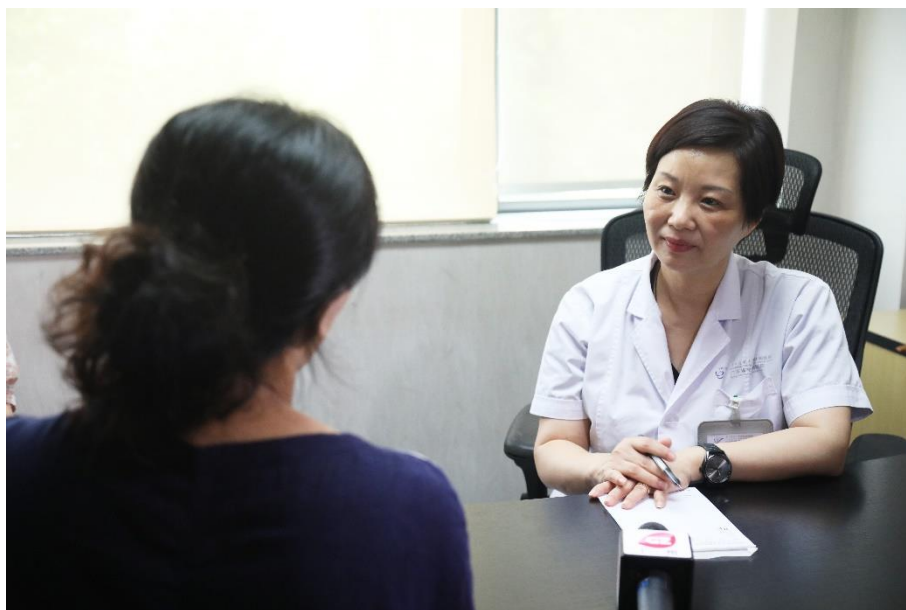
杨斌教授向特应性皮炎患者询问病情

中重度特应性皮炎（atopic dermatitis, AD）是一种难治性、复发性、炎症性皮肤病，以反复发作的剧烈瘙痒和皮疹为主要临床表现，患者常合并过敏性鼻炎、哮喘等其他特应性疾病。亚洲国家及地区多项调查显示，成人特应性皮炎的患病率为0.9%-2.1% 1,2,3 。