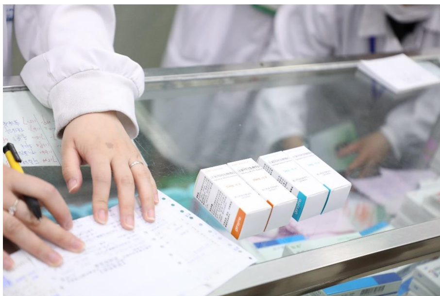
法布雷病患者取药

法布雷病临床症状的多样性导致就诊患者散布在多个临床科室，如儿科、神经科、肾脏科、风湿免疫科、消化科、皮肤科和心脏科等，及时确诊非常困难。有患者从发病到确诊时间需要十多年，在此期间，患者四处寻医求药，常常接受许多不恰当的治疗，给患者以及家庭造成沉重的经济和精神负担。