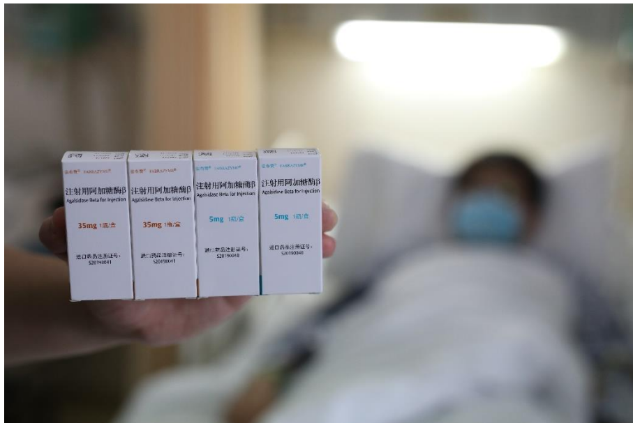
酶替代疗法 (ERT) 法布赞® 送达病房

一项多中心、随机、双盲、安慰剂对照研究显示：法布赞®可降低主要临床事件（肾脏、心脏、脑血管并发症或死亡）发生率达 61%；另有 10 年长期随访证实，法布赞®持续治疗可有效稳定法布雷患者肾脏等主要脏器疾病进展、保护心脏功能，及早治疗患者获益更大 1,2 。